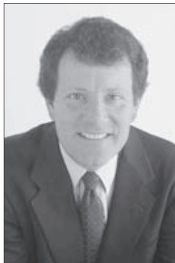
NICHOLAS D. KRISTOF © 2012 New York Times

If you want a case study of everything that is wrong with money politics, this is it.